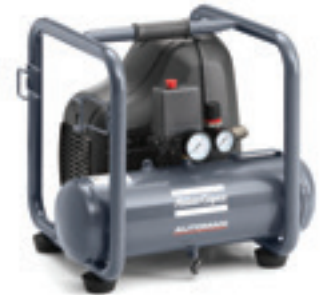
AH 20 E 6