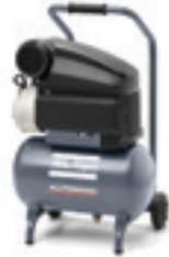
AF 20 E 10