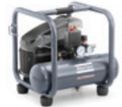
AF 25 E 6

Série AF, 230 V monophasé - 10 bar(e)/145 psig pour AF 25, 400V 3 phases 10 bar(e)/145 psig et 230V 10 bar(e)/145 psig pour AF 30 Entraînement direct - fixe ou mobile - réservoir horizontale 2 x 11, 6, 9, 10, 24, 50 ou 90 l