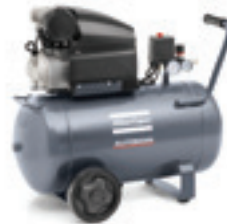
AF 25 E 50