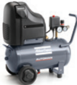
AH 15 E 24