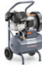
AF 30 E 24