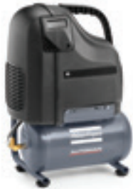
AH 10/15 E 6

Les compresseurs non lubrifiés de la série AH sont conçus pour de nombreuses applications. L'huile n'ayant pas besoin d'être remplacée et le moteur électrique étant fixé au bloc compresseur par un raccord à brides, l'entretien est réduit au strict minimum. Grâce à leur construction légère tout aluminium, ils constituent le choix idéal lorsqu'une faible quantité d'air comprimé suffit. Ils peuvent être transportés à plat.