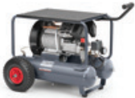
AF 30 E 2X11