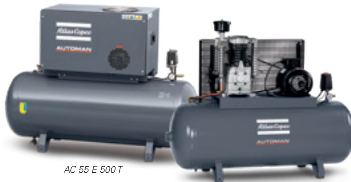
AC 55 E 500 T